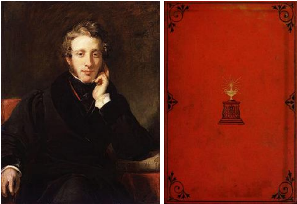
O autor e sua obra: Sir Edward Bulwer-Lytton e a Capa da edição de 1871 da obra The Coming Race (A Raça Futura)

Qual será essa nova força, em que contribuirá ela para o progresso da raça humana, e através do que chegaremos a descobri-la? Esta é a tríplice e natural pergunta que tentaremos responder.