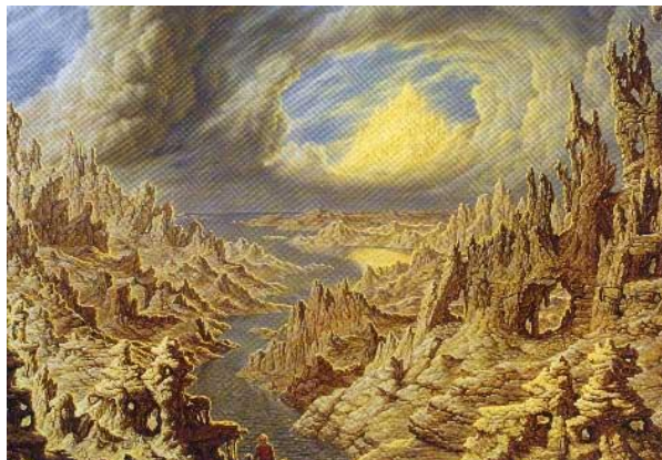
GEOLOGICAL WANDERING, Johfra

T anto se tem falado dos mundos internos sob o ponto de vista oculto, tanta ênfase tem-se posto no fato de que possuímos veículos superiores e de que somos capazes de desenvolvê-los e neles funcionar conscientemente, que parece necessário, de tempos em tempos, ressaltar o enorme valor do corpo denso e do mundo visível ao qual ele nos correlaciona, isto para que se neutralize tanto quanto possível o menosprezo de algumas pessoas ao mundo físico em que vivemos.