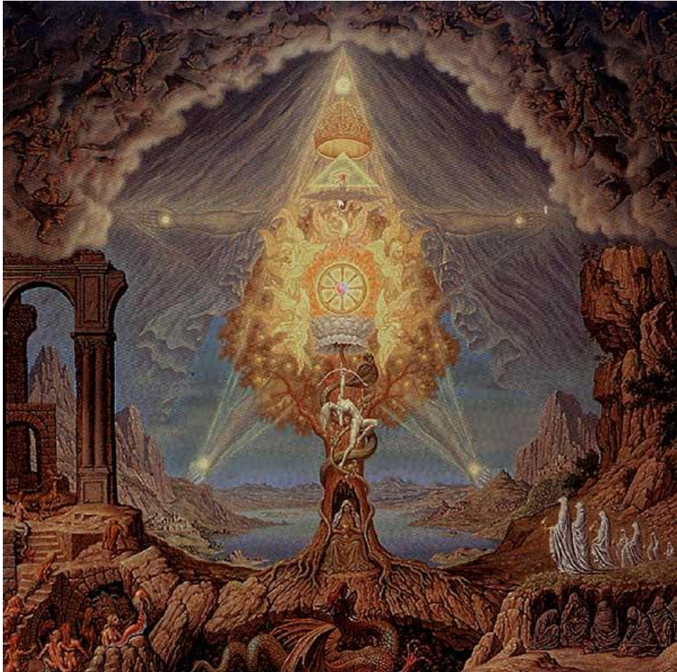
INTERIOR OF UNIO MYSTICA (1973), Johfra