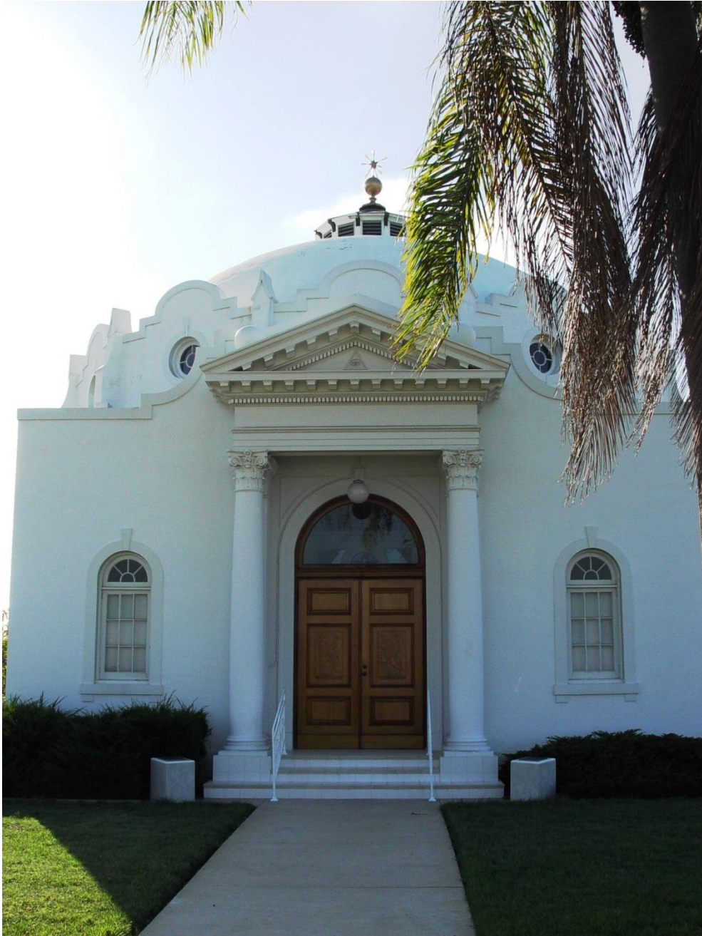
Templo Rosacruz em Mount Ecclesia